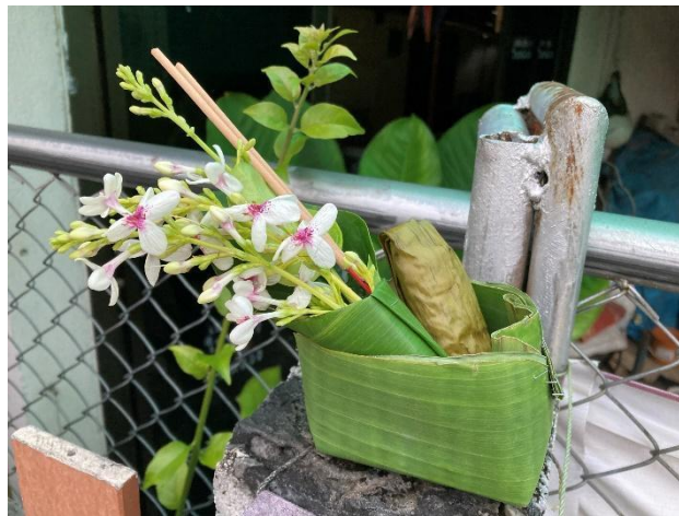
ภาพ : อื้องบูชา

ประเพณีไหลเรือไฟกปีนี้ตรงกับวันที่ 10 ตุลาคม 65 ขึ้นเดือน 10 เพ็ญ ออก 15 ค่ำ แม่บ้านเริ่ม ตระเตรียม อื้องบูชา(กระทงดอกไม้) ทำอาหารทั้งคาว-หวาน ตั้งแต่เย็นวันที่ 9 ตุลาคม 65 เพื่อนำไปตักบาตร ในเช้าวันที่ 10 พอเช้ามืดวันที่ 10 วันออกพรรษา ขึ้นเดือน 10 เพ็ญ ออก 15 ค่ำ ชาวบ้านเตรียมอื้องบูชา (กระทงบูชา) ประกอบด้วยดอกไม้ ธูป เทียน ของหวาน แล้วนำไปวางตามจุดสำคัญในบ้าน 3 จุดหลัก จุดแรก วางไว้ประตูหน้าบ้านด้านนอกเพื่อไหว้เจ้าที่เจ้าทาง จุดที่สองวางไว้ประตูบ้านด้านในเพื่อไหว้เจ้าบ้านเจ้าเรือน จุดที่สามวางไว้หน้าเตาไฟที่ใช้ทำอาหารเพื่อไหว้เจ้าแม่ นางคำ จากนั้นเตรียมตัวไปวัดเพื่อประกอบพิธีกรรมทาง ศาสนา